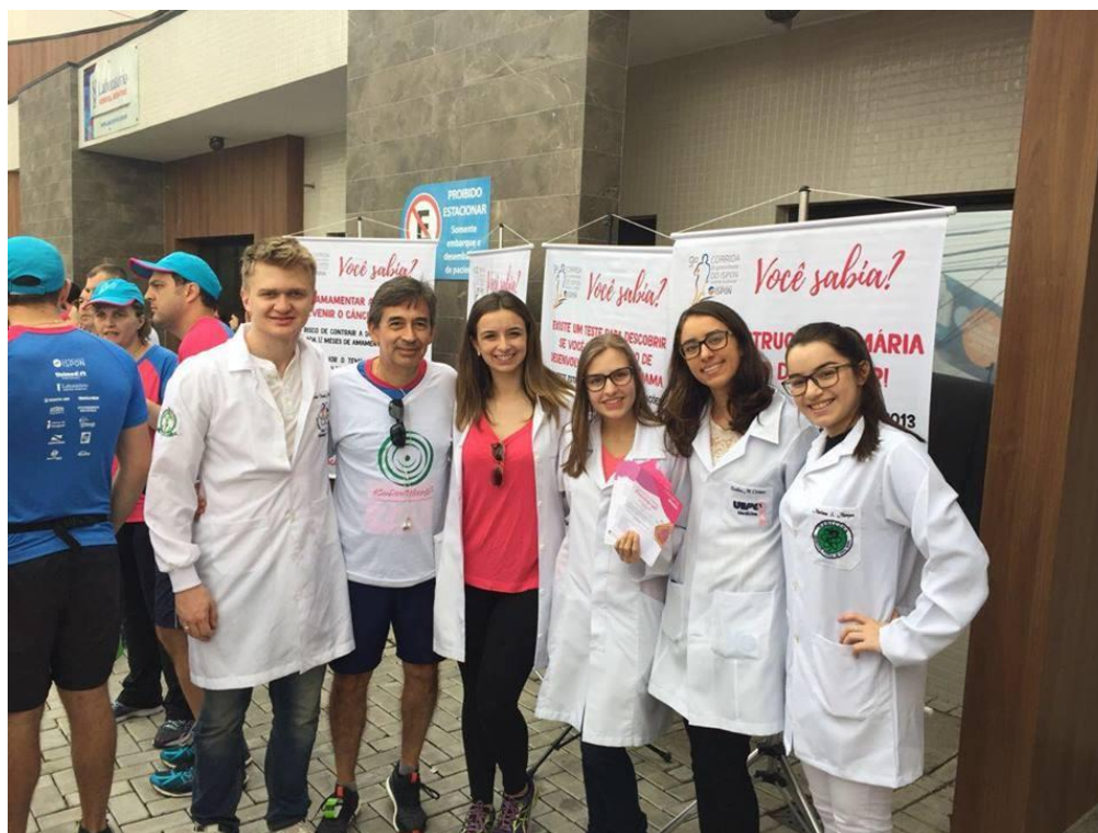
Figura 3 – Membros da Liga Acadêmica da Mama

Legenda: Acadêmicos e Professor Colaborador da Liga Acadêmica da Mama na 9ª Corrida e Caminhada do Ipson contra o Câncer.