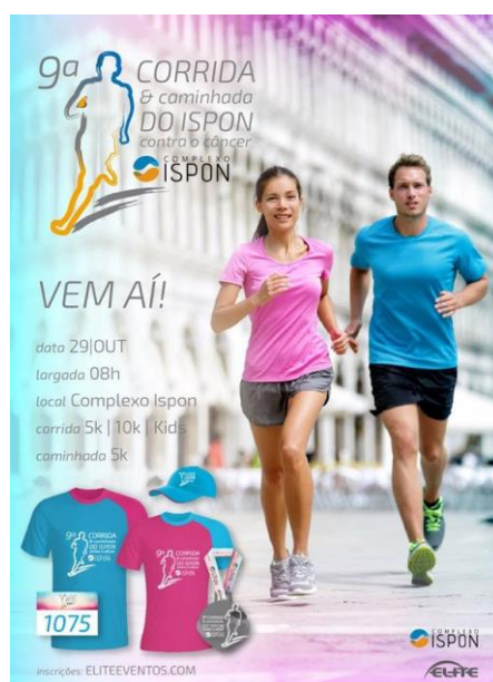
Figura 1 – Cartaz de divulgação da 9ª Corrida e Caminhada do Ison contra o Câncer

Legenda: Cartazes de divulgação da corrida distribuídos em toda a cidade na forma física e através das redes sociais. Contém informações pertinentes sobre data, local, hora de largada e modalidades de corrida para inscrições.