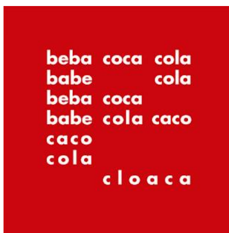
Figura 1. Beba Coca-Cola, 1957. Décio Pignatari.

O Grupo Ruptura de São Paulo e o Grupo Frente do Rio de Janeiro compuseram o cenário artístico brasileiro da década de 50 tratando fortemente do abstracionismo geométrico e da poesia concreta. De caráter experimental, a poesia concreta (fig.1) busca uma libertação da unidade rítmica, ocupando de modo visual a disposição das palavras em seu suporte. Décio Pignatari aborda a poesia e sua relação com os meios de comunicação em massa, sendo para ele uma junção deste meio com os fundamentos da linguagem, distanciando a poesia concreta das noções literárias de poesia e literatura. (PIGNATARI, 1973, pg. 16)