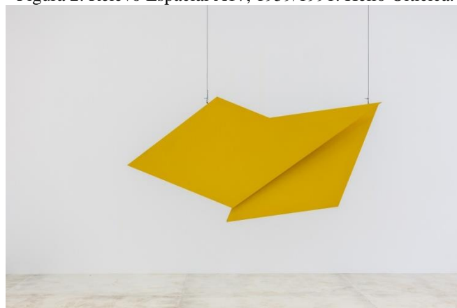
Figura 2. Relevo Espacial A17, 1959/1991. Helio Oiticica.