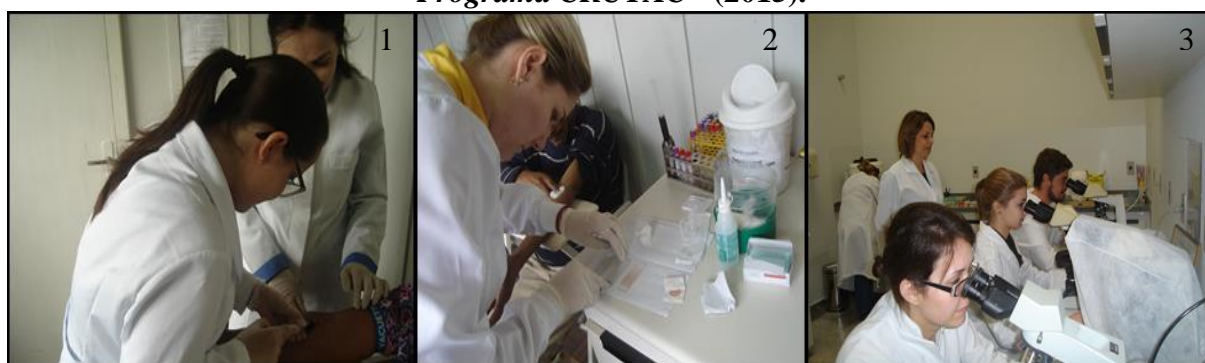
Figura 3 – Algumas das ações desenvolvidas no CRUTAC pela equipe de professores e alunos do projeto "Avaliação laboratorial na assistência à saúde e prevenção de doenças - Programa CRUTAC" (2015).

Na imagem estão representados: (1) Atendimento no posto de coleta de materiais biológicos do CRUTAC, (2) Realização de esfregaço hematológico durante coleta e (3) Exames sendo realizados no Laboratório Universitário de Análises Clínicas, sob orientação dos professores supervisores.